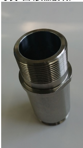
内径硬化メッキ後 (シリンダー)